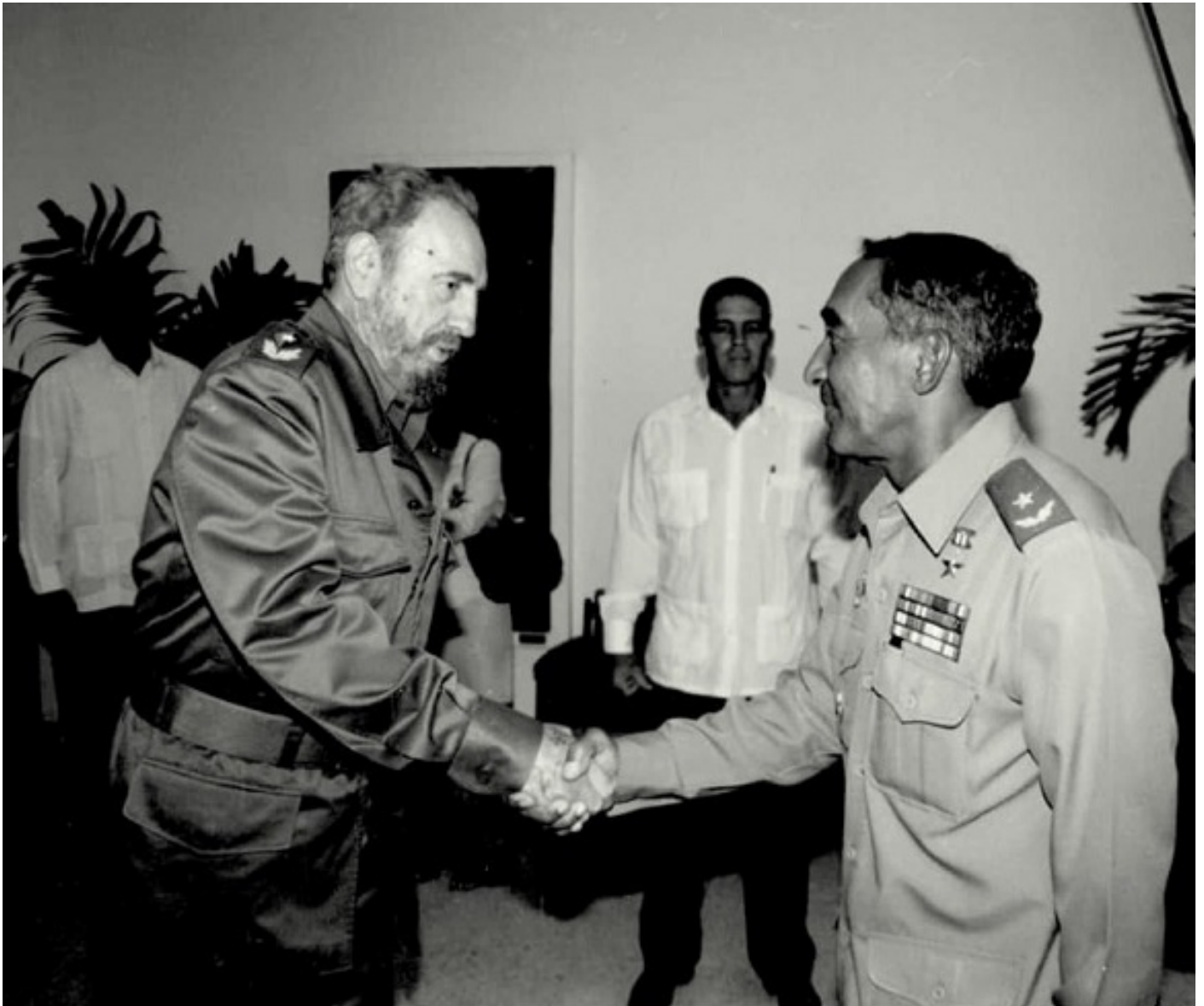
El líder de la Revolución Cubana Fidel Castro junto a Arnaldo Tamayo.

Junto a otros 40 candidatos de la mayor de las Antillas se presentó a la convocatoria para futuros cosmonautas, que tenía entre sus requisitos contar con más de 10 años de experiencia como piloto, estar apto desde el punto de vista médico, físico, con conocimientos técnicos y profesionales para una misión de ese tipo, y dominar el idioma ruso.