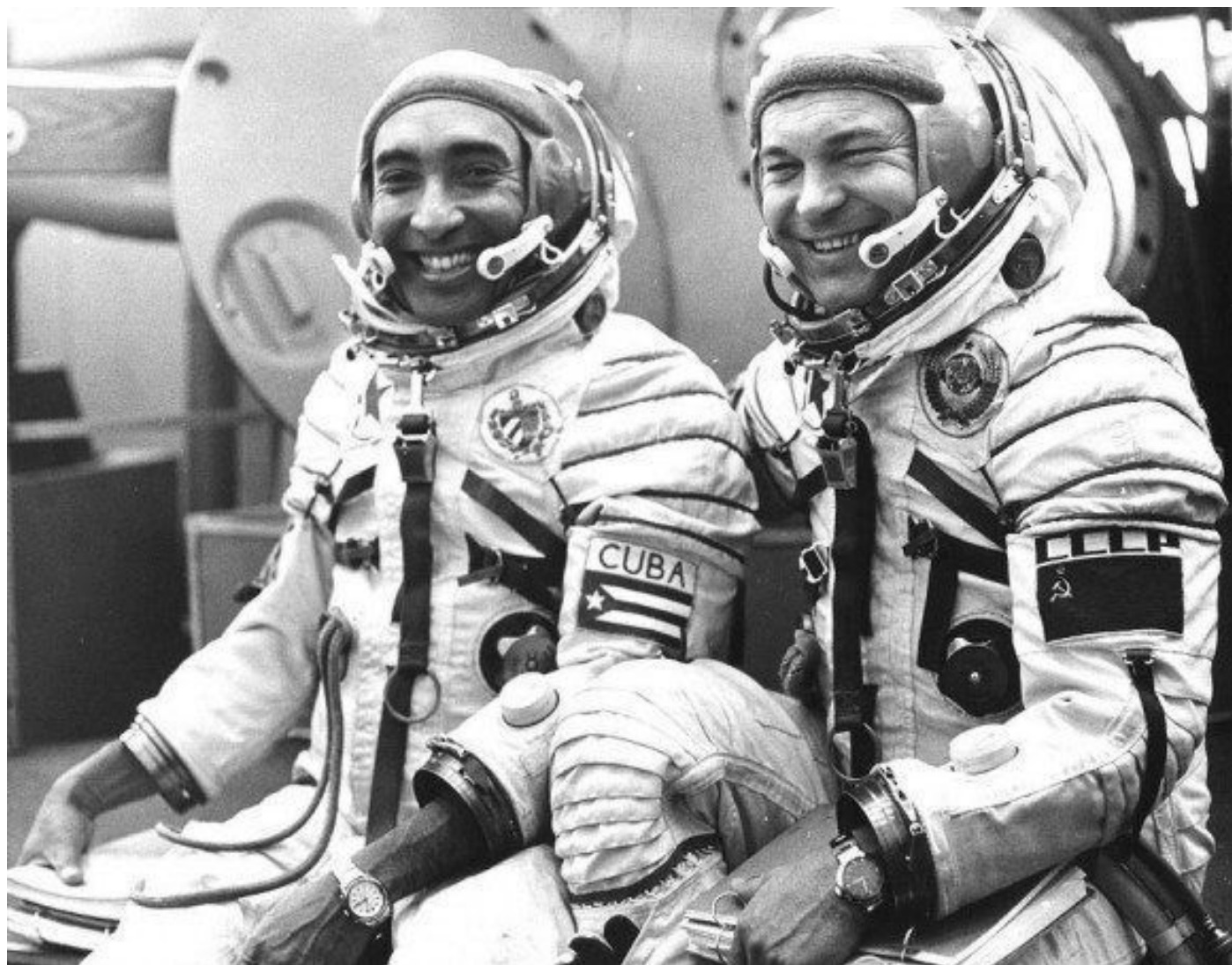
Hace 40 años, un guantanamero, mestizo y humilde, se convirtió en el primer cosmonauta de Latinoamérica.

Miguel Díaz-Canel Bermúdez, presidente de la República de Cuba, recordó este viernes en su cuenta oficial en Twitter la hazaña de Arnaldo Tamayo Méndez al convertirse en el primero latinoamericano en ascender al espacio exterior.