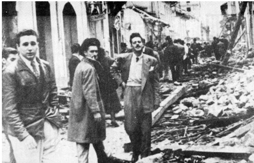
Durante los sucesos del Bogotazo.

Simpatizante del Partido del Pueblo Cubano (Ortodoxo) , de tendencia progresista, participó de manera activa a partir de 1948 en las campañas políticas de ese Partido y, en particular, de su principal dirigente, Eduardo R. Chibás. Dentro de su organización política trabajó por cultivar entre la militancia joven las posiciones más radicales y combativas. Tras la muerte de Chibás, redoblo sus esfuerzos para desenmascarar la corrupción del gobierno de Carlos Prío.