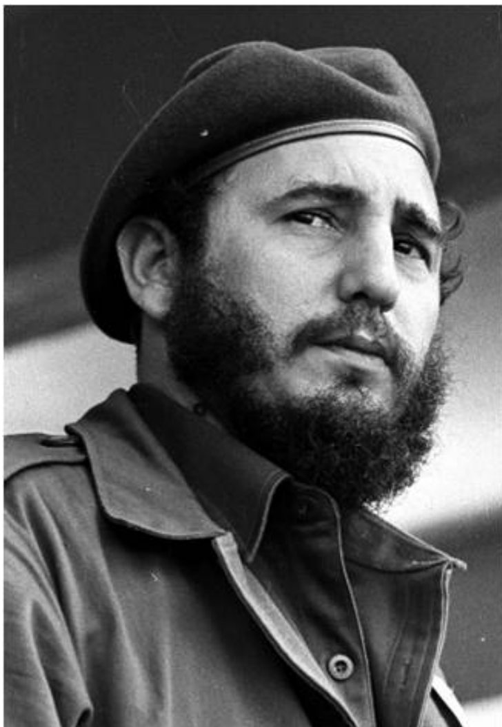
Fidel en un acto en El Cacahual,

Al concluir la lucha insurreccional, mantuvo sus funciones como Comandante en Jefe. El 13 de febrero de 1959 fue nombrado Primer Ministro del Gobierno Revolucionario.