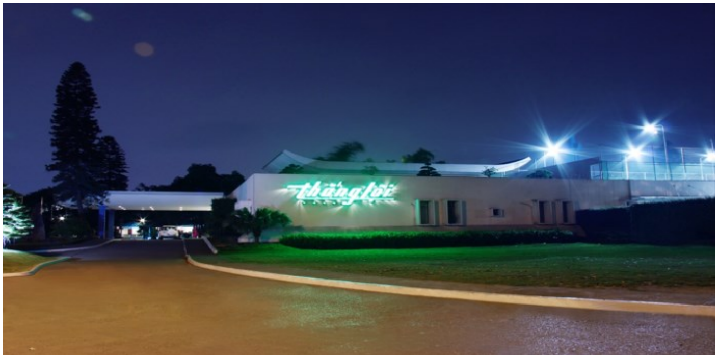
El hotel Thang Loi, ubicado en el lago oeste de Hanoi, tiene 156 habitaciones. Fue inaugurado en 1975 y

Vietnam se ha convertido en el segundo socio comercial de Cuba en Asia, asegura Dung Tran, lo cual permite proyectar un nuevo acuerdo comercial y otros de cooperación en aras de elevar el volumen de negocios desde los 250-260 mil millones de dólares anuales de hoy hasta alcanzar los 500 mil millones de dólares en el 2020.