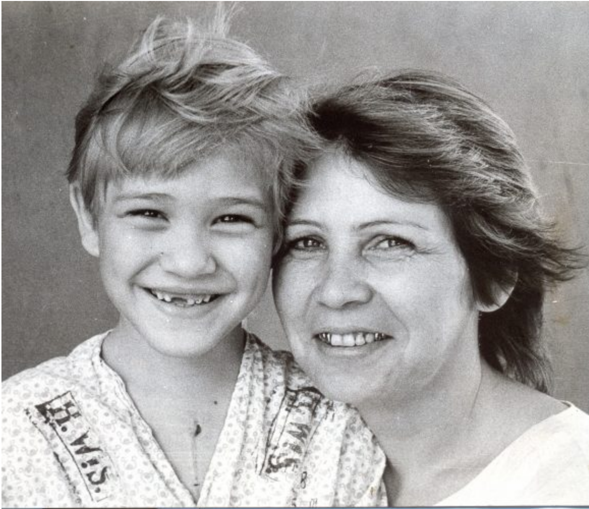
Madre e hijo