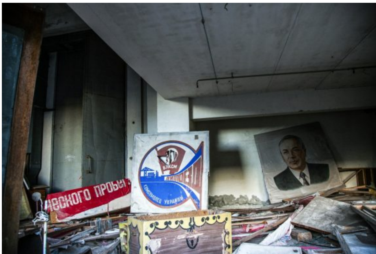
Oficina de la

Juventud Comunista de Pripiat, noviembre de 2019.