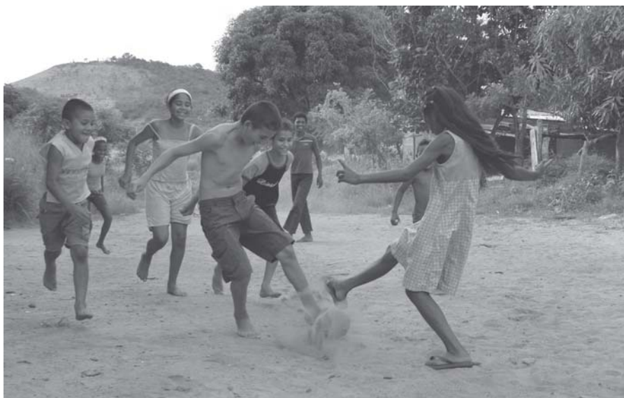
Un enjambre de niños y adolescentes levantaban el polvo amarillo del barrio Sierra Tres, del municipio Piar, Estado Bolívar.

de los montes cercanos, y el polvo de los caminitos sin asfalto y aledaños a las casas recién hechas o a medio hacer, parecen decir la última palabra.